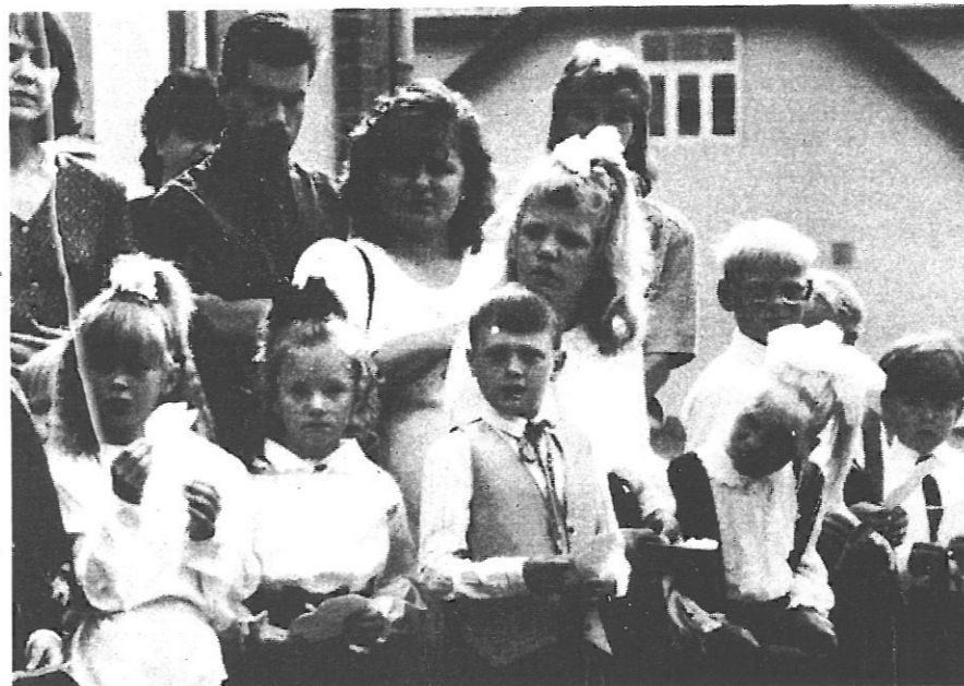
* Pirmklasnieki pagaidām vēl drošāk jūtas, ja tētis un mamma aiz muguras.