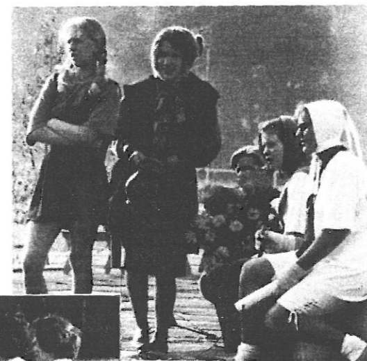
* Pirmklasniekus skolā ievadija viņu iemīļotie pasaku varoņi.