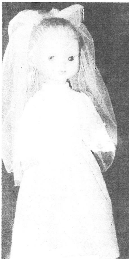
* Inas Terļeckas lelles tērps.