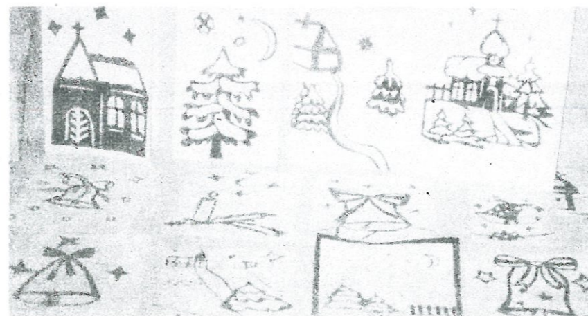
* Melnā papīra mežģīnes.